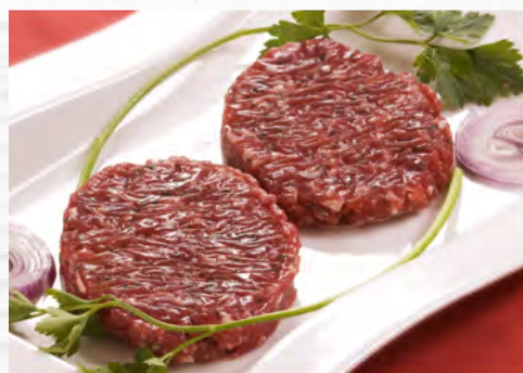
Hamburguesa misturada Kg