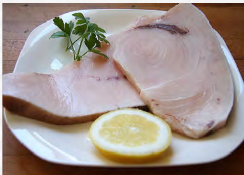
Roda peixe espada "extra" Kg