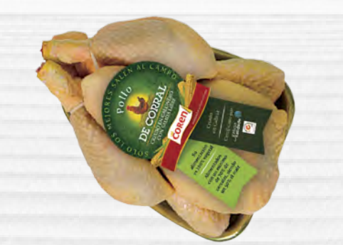
Polo curral COREN Kg