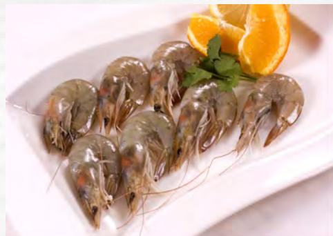
Langostino Vannamei 35/45 Kg