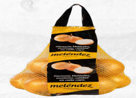
Cebola MELÉNDEZ Malla 2 kg