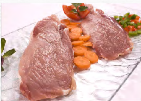
Filetes de porco Kg