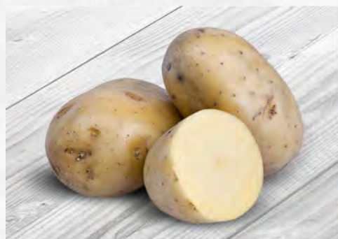
Pataca branca Kennebec Kg